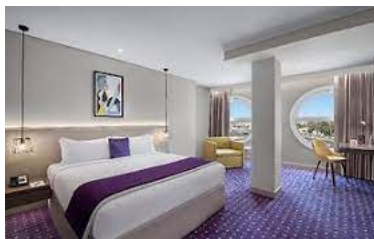
Un breve riposo in hotel

arrivo all'alba, nella fantastica Dubai dove staremo fino al 5 giugno